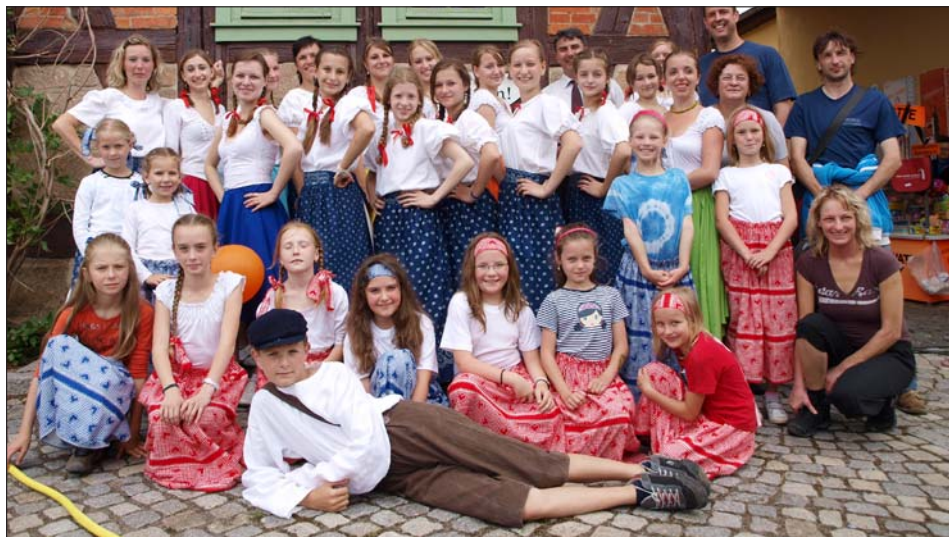
Účastníci zájezdu ve Ströbecku