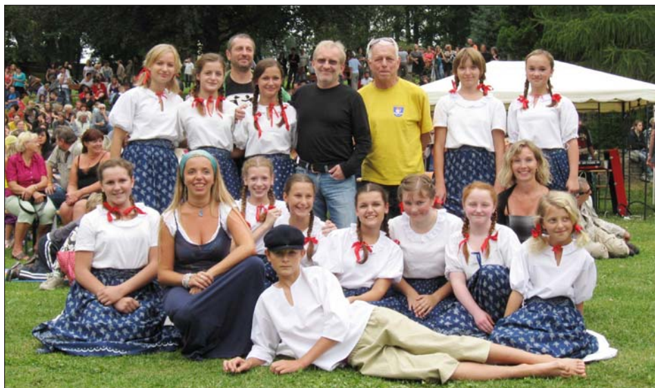
Žáci ZUŠ se skupinou Čechomor.

Na základě talentových přijímacích zkoušek, které proběhly v měsíci červnu, bylo ke studiu přijato 22 žáků do základního studia 1. stupně, 34 žáků do přípravného studia. Dětem, které splnily podmínky talentových zkoušek, a přesto nebyly přijaty do ZUŠ Bystré z důvodu plné kapacity, jsme nabídli výuku v před-přípravce v tanečním a výtvarném oboru.