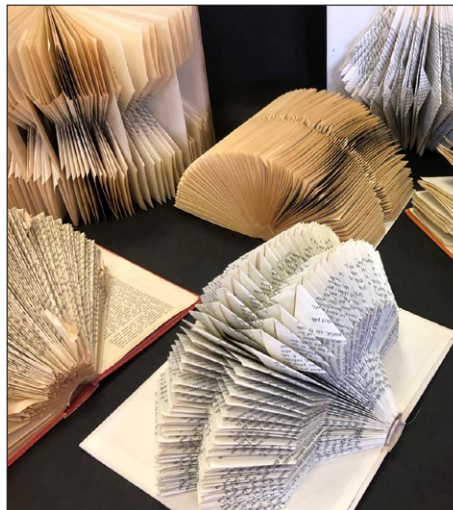
MDVV Lidice 2026 – Kniha objekt