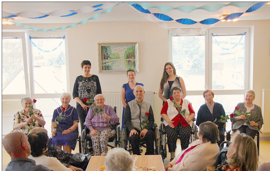
Slavnostní předtančení – účinkující

Ples byl zahájen 31. ledna 2026 ve 14 hodin. Úvod patřil předtančení obyvatel, které sklídilo zaslužený potlesk. Poté se ujala slo-