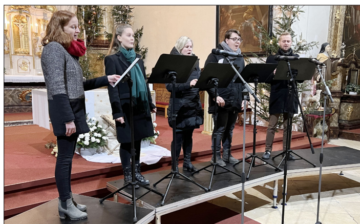
Nově vzniklý Vokální kvintet.

Popisky: ZK