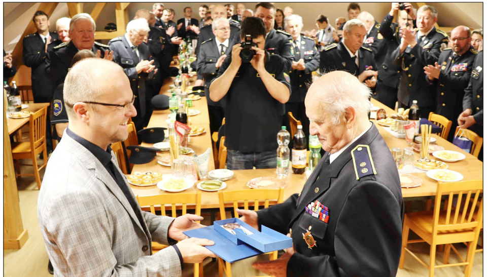
Předání Medaile hejtmana Pardubického kraje