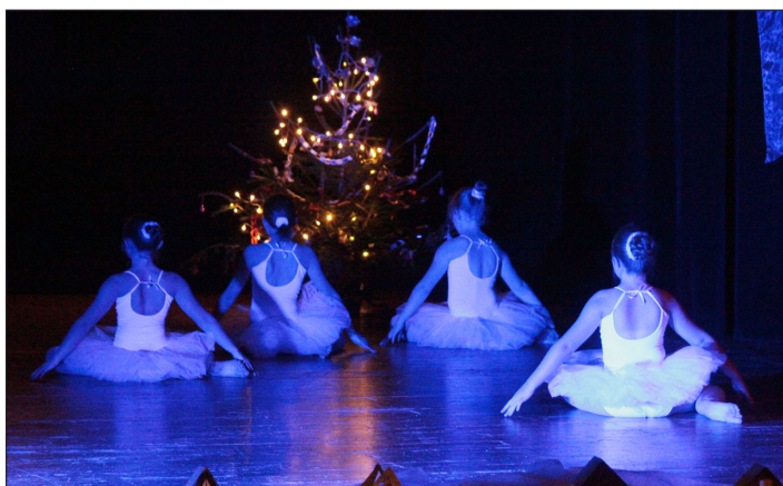
Vánoční koncert v Bystrém. Balet Sněhových vloček.