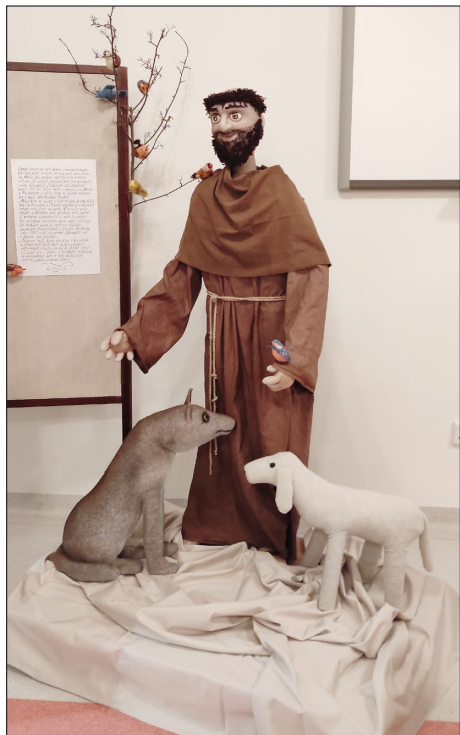
Sv. František z Assisi

Po dvou letech se v Bystrém od 1. prosince do 1. ledna konala výstava betlémů. Její slavnostní zahájení doprovodil program, který si připravila mládežnická schola bysterské farnosti. Zároveň jsme si připomněli tradici betlémů starou 800 let, protože na Vánoce v roce 1223 v italském Grecciu zinscenoval sv. František z Assisi tzv. živý betlém – scénu narození Páně v chlévě s živými zvířaty. Proto také všechny návštěvníky