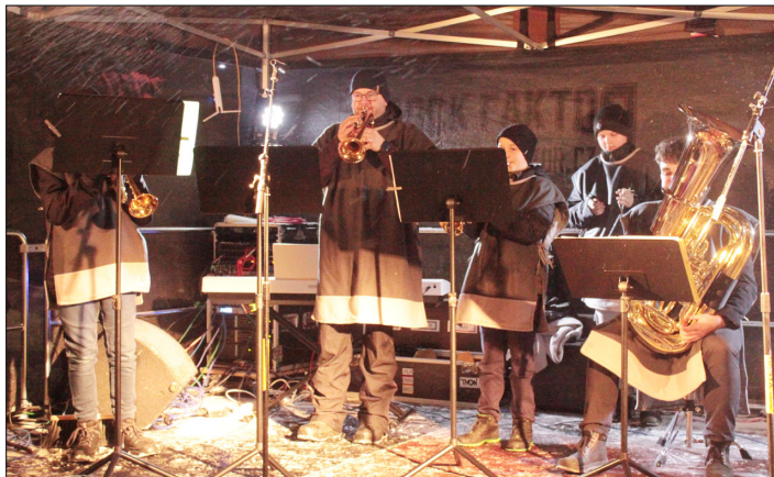
Rozsvícení vánočního stromu v Bystrém. Žestový septet.