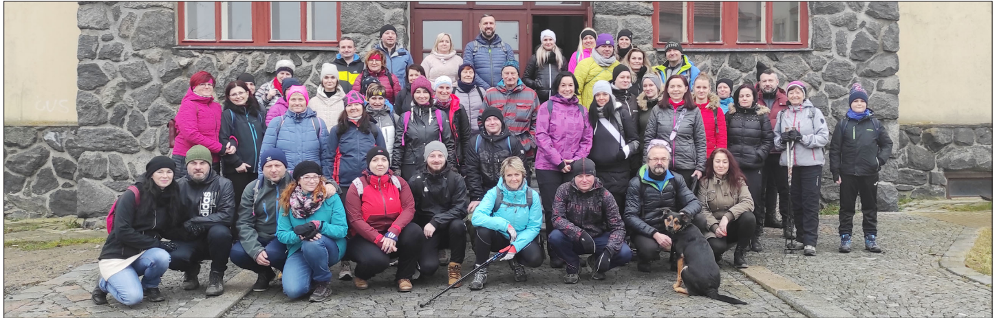
Společná fotografie před startem.

Jménem všech spokojených účastníků děkuje Z. Klodnerová