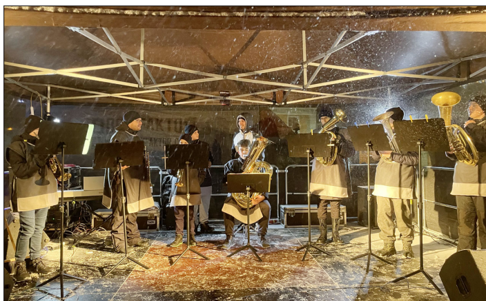
Klarinetový kvartet s tubou.