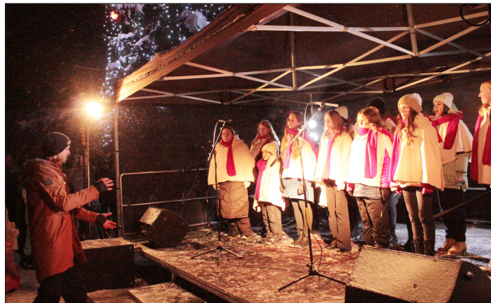
Pěvecký sbor Simba. Na stejném pódiu o chvíli později.