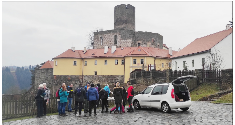
Prvních patnáct v prvním „cíli“ – na parkovišti před hradem.

Od 1. 1. 2024 je cena vodného, stočného je 96 Kč/1 m 3 . TS Města Bystré