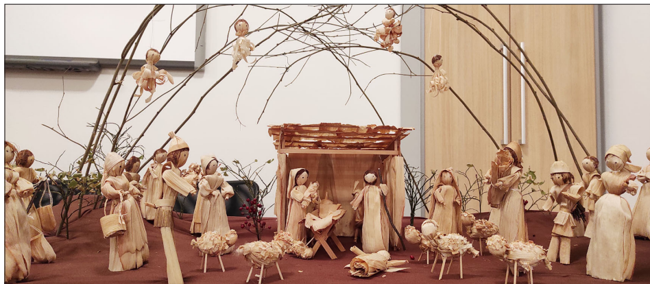
Betlém z kukuřičného šustí