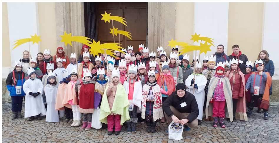
Koledníci a vedoucí skupinek po požehnání