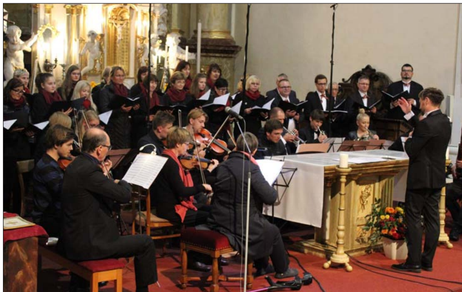
Pohled na početný ansámbl Chorus Carolinus Kladno.