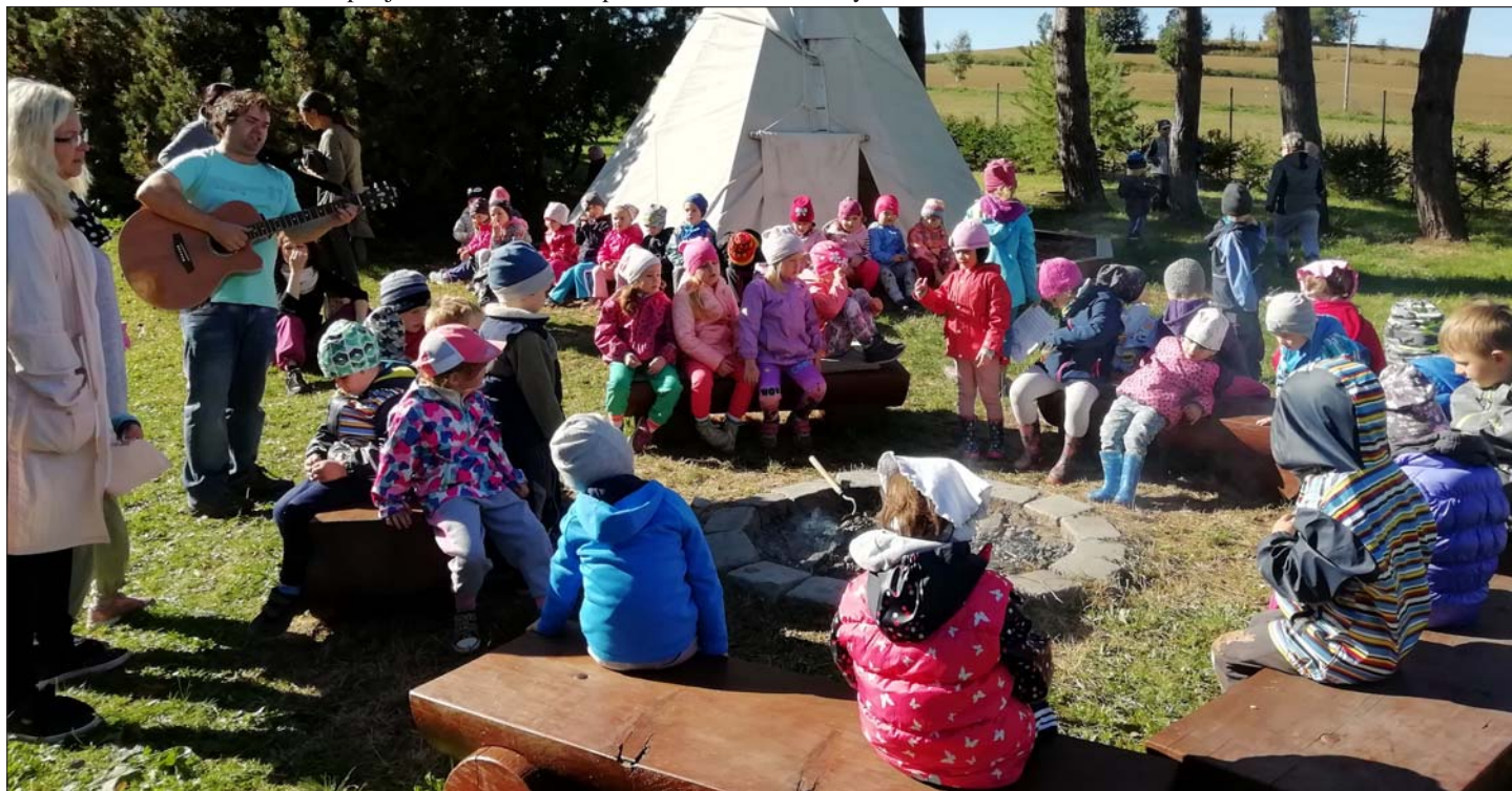
K podzimu patří opékání brambor. Opekli si je i naši nejmenší.