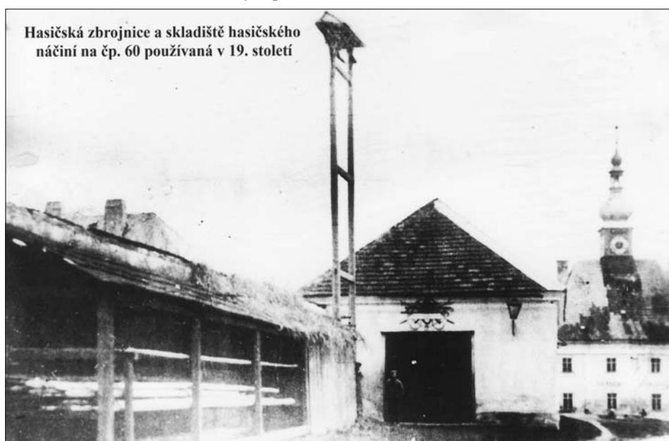
Hasičská zbrojnice a skladiště hasičského náčiní na čp. 60 používaná v 19. století