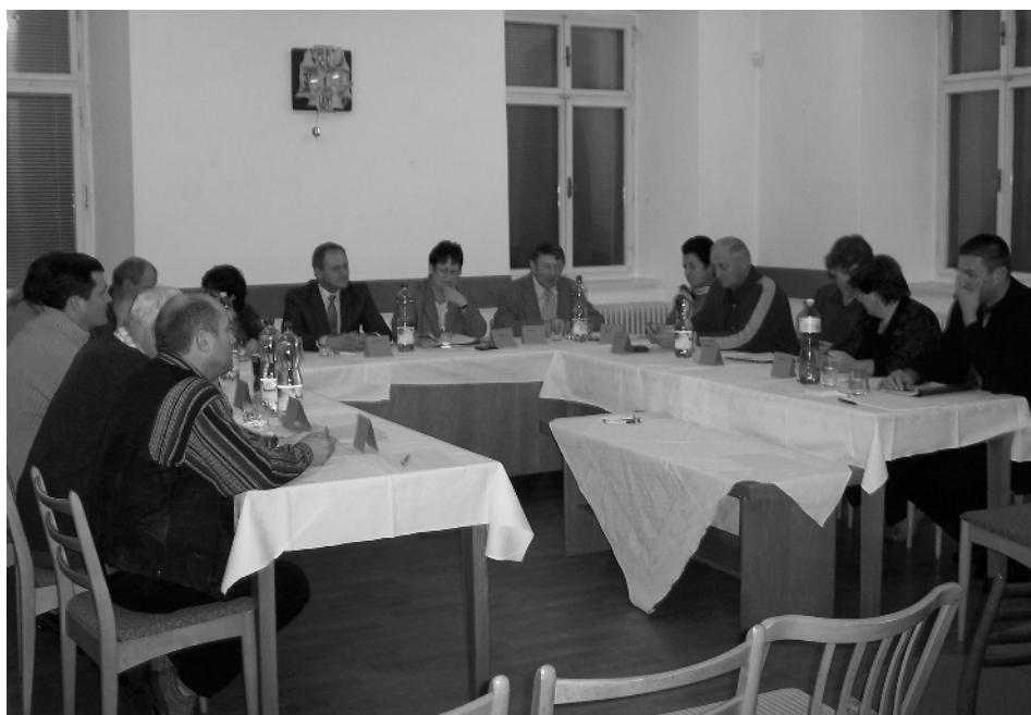
Ustavující schůze ZM 3. 11. 2006.