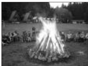
Soustředění dětí na Baldě